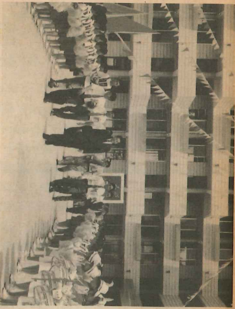
少青隊隊員列隊敬送各嘉賓盛況