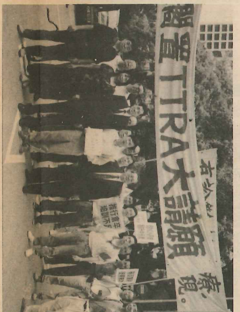
多年並肩作戰「為辦好教育」而努力的一班戰友