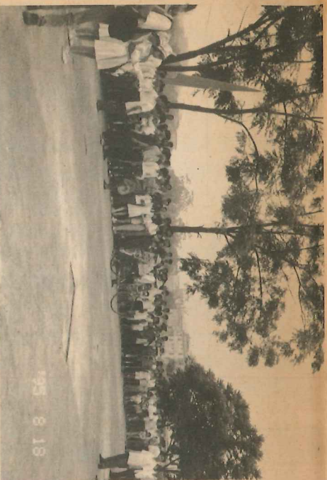
羅董鎮鄉民在路旁見證歷史性的開幕儀式

經過一天的奔波，代表團各人爭分取時間，儘量休息，並期待揭幕禮的來臨，與當地市民一同分享「育苗樓」落成的喜悅。「育苗樓」的落成，不單獨對內地學生意義重大，對於捐款人之一的香港學生來說同樣重要，因為育苗助學計劃可幫助學生建立「施比受更有福」的正確價值觀，並透過閱讀報章與參與，使其更珍惜目前所擁有的學習機會和家庭生活，有苗助學計劃」的積極影響可算極之深遠。