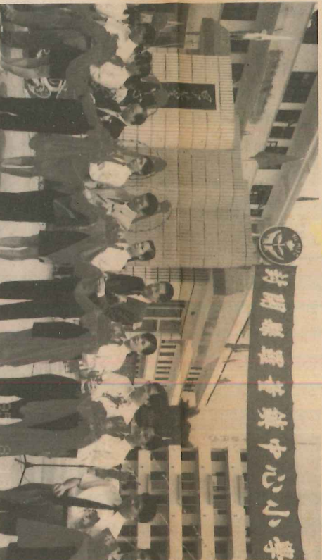
吉時已到各主禮人主持剪綵儀式

是次揭幕禮封開縣人民政府是一項空前盛事，儀式隆重，場面壯觀，單是邀請嘉賓已達二百多位，其中除香港代表團外，省、市、縣各級領導亦親臨祝賀。「育苗樓」的落成，標誌著廣東省偏遠山區教育發展的新里程碑，亦對縣教育事業發展起着鼓舞作用，我們祈望中國的球懸掛著對聯所言：「育才輩出」及「苗秀茁壯」。