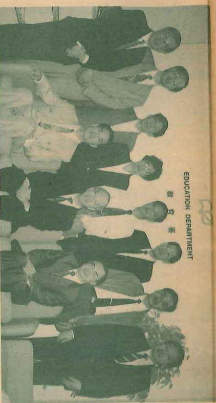
參觀後，才結束了這次訪港之行。