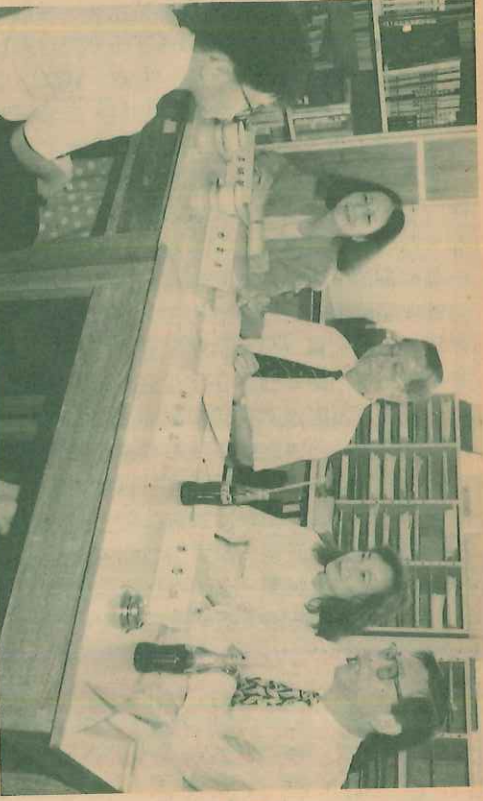
評判平易近人，傑生從容應對

評分上，的確花了許多心思，以致面試超時。他們投入的態度，真教人佩服呢！初選後的十天便是複選的日子，同學們汲取了初選的經驗，大都神態自若，表示這選舉既好玩又有意義，即使不能得獎，也並不會感到失望。他們甫出面試房間，就立即走到家長身旁，訴說面試時的情形及題問內容，還毫不