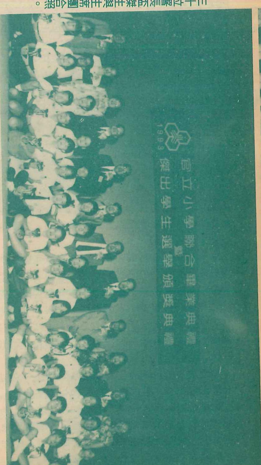
三十位署長杰生與主席團合照。