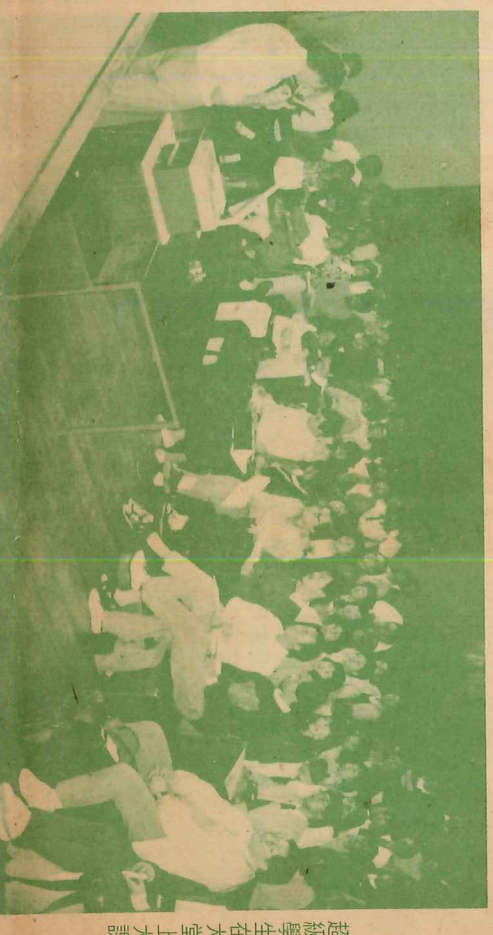
超級學生在大堂上大課

或麵包、咖啡或茶。午餐有飯有肉，生菜或甜品、咖啡或茶。唯一可惜的是份量普通，而輪候時候較長，有時需時廿分鐘才輪到自己拿取食物，況且輪候方式天天新穎，日不同。學員每次進入餐廳後，都要研究一下如何排隊才正確，否則別人會誤會你不守秩序「打尖」的。 距離BIBBY大概四十分鐘車程便到達伯明翰。那裏有較多中國餐館。學員都會到那裏嘗嘗家鄉味道的飯餐。廚房的手勢及鐵氣不感。唯一分別是價錢相當「重」，一英鎊多一磅四十便士，問你怕不怕？ 老實說，百多人往英國一起讀書，一起生活，未免單調一些。故此，學院亦有安排多次旅遊節目，包括到倫敦、北威爾斯等著名的遊覽地方參觀。雖是走馬看花，仍不失為尚佳安排，起碼能調劑一下緊張的生活。 回港日子近了，學員除了要應付功課及測驗外，還得準備收拾細軟。八月十二日下午四時是我們上的最後一節下課學員便趕着回宿舍更衣。有很多還邀請導師吃晚飯，算是謝師宴的了。跟着十三日早上七時，便有八十多名學員離開學院往倫敦。雖然返港日子是十四日，但學員希望爭取多一天留在倫敦購物及遊覽。亦有一些學員早已安排行程往歐洲旅遊，儘量享受一下暑假餘下來的日子。 今年的課程其實還沒有完成，因為學員要在十月份內交功課，寄給英國學院的導師，以俟還得繼續的為功課及溫習，直到一九九一年。